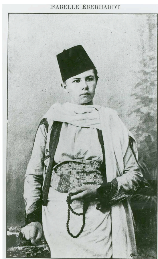
Portrait réalisé dans un studio de photographe à Tunis. Dans la vie, Isabelle Eberhardt avait horreur qu'on la prenne en photo, mais de temps en temps, à 20 ans, elle acceptait de se costumer pour poser devant l'objectif d'un artiste. Dans la vie quotidienne son vêtement était plus sobre.

À Tunis, déjà habillée en homme, elle choque profondément les notables, qui iront jusqu'à l'accuser de débaucher les jeunes aristocrates prometteurs. Elle dépense sans compter son modeste héritage après la mort de sa mère et de son tuteur, et part vers le sud pour y vivre la plupart du temps dans un grand dénuement.